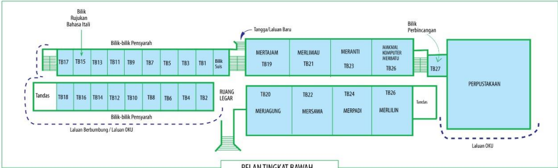
PELAN TINGKAT BAWAH