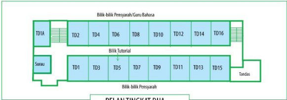
PELAN TINGKAT DUA